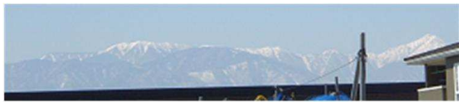
食堂からは北アルプスを眺望できます。