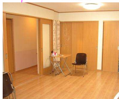
機能訓練室は食堂とつながっていて、ゆったりと使え、縁側みたいに日当たりも良好。