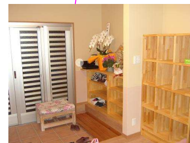
玄関はスロープあり、ゆったりです。