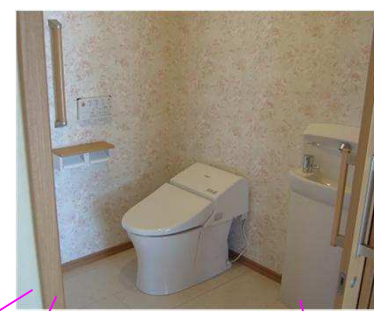
ゆったり広さのトイレは3ヶ所あります。