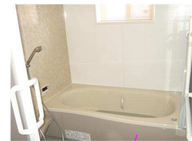
明るい一般浴槽が2ヶ所あります。