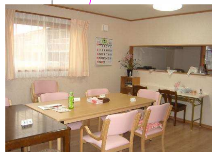
自宅のと同じ雰囲気の食堂です。