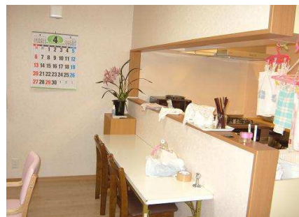
食堂と一体型の厨房です。