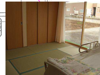
静養室にはベッドがあり、ゆっくりとお休みいただけます