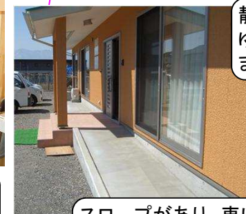
スロープがあり、車いすでも出入りはスムーズです。