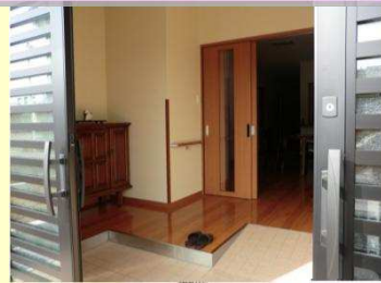
事業所の顔。自宅のよう