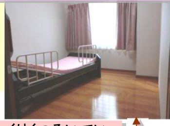
ゆっくりくつろいでいただく宿泊室です。個室でも複数名でも。