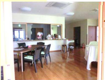
一人一人が思うとおりに過ごしていただけるデイルームです。