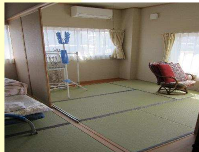
くつろげる和室です。宿泊室にもなります。