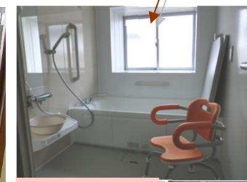
浴室です。できるだけご自分で入れるようにお手伝いします。