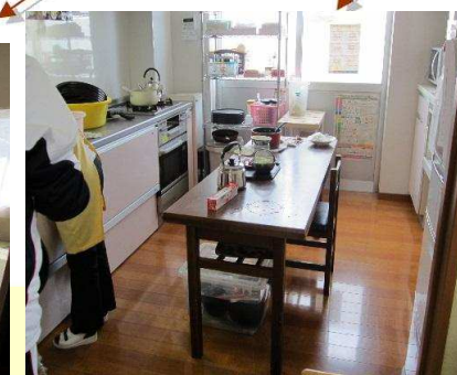
自宅と同じ雰囲気の台所です。一緒に調理も!