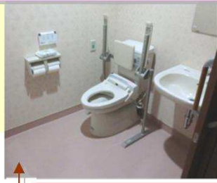
トイレは、屋内に4ヶ所あります。いつでもご利用ください。