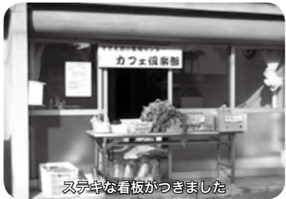
ステキな看板ができました