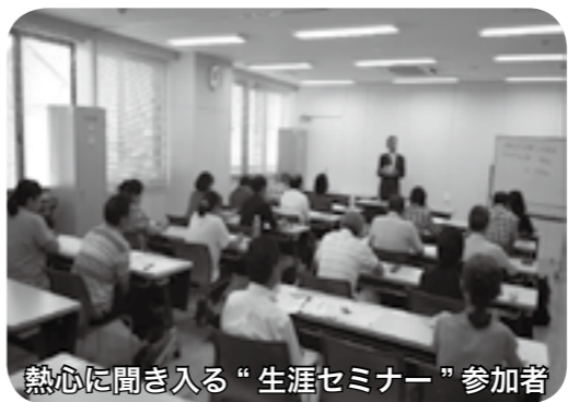
熱心に聞き入る“生涯セミナー”参加者

らの生涯現役セミナー」の開催が 同時期から中信エリアでもスタ ート。セミナーは少子高齢化社会の 中、生涯現役で働き、地域貢献な どを通じて、高齢期の生活設計や 生きがいある人生を考えていた こうと行ったもので、中信では、 松本市をはじめに近隣4市1町で 11月末までに6会場で開催しまし た。開催に先立ち各市町で発行さ れる広報にも掲載され、またエリ ア情報紙誌でも記事として取り上 げてもらうことができ、組合員加 入にもつながりました。