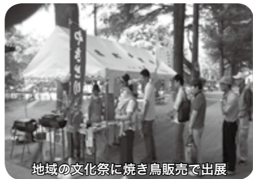
地域の文化祭に焼き鳥販売で出展