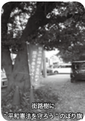
街路樹に “平和憲法を守るう”のぼり旗

“高齢者生協”の名が、今年 の月間ほど地域に知れ渡ったこ とはないように思います。戦 後70年を迎えた今夏、「戦争の 惨禍を忘れず、平和憲法を守ろ う！」と平和への思いを行動へ、 組合として初めて「核兵器廃止 国民平和大行進に参加して公道 を歩いた取り組みを皮切りに、 戦争法案への反対のうねりが日 増しに高まる情勢を後押し、9 月の組織強化月間につなげ、平 和を守る行動を広く呼び掛けよ うと「憲法9条にノーベル平和 賞を」の署名活動を8月から進