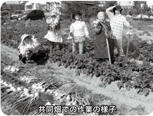
共同畑での作業の様子