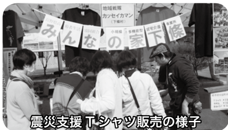
震災支援 Tシャツ販売の様子