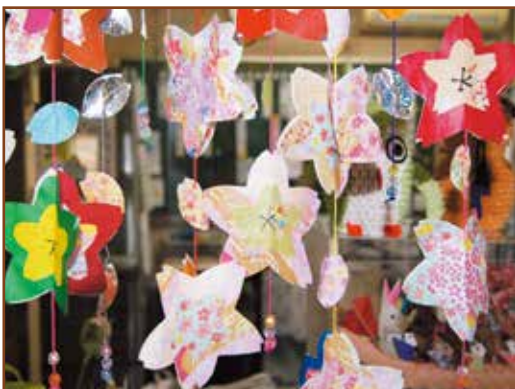
長野市いきいきサークル (長野市生きがいデイサービスの) 「花のれん」

利用者さんの合同作品です。力を合わせて作りました。憩の家で展示中。風に揺れるととてもきれいです。