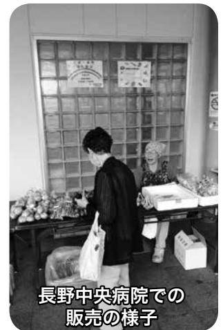
長野中央病院での販売の様子